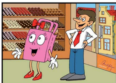
V prodejně firmy Pražská čokoláda.