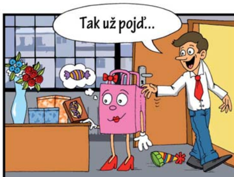
Z bonboniéry nemůže taštička spustit oči. Ráda by ochutnala alespoň jeden kousíček.