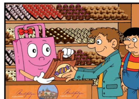
Taštičce se splnil další sen.

Ilustroval: © Mirek Vostrý Námět: Petr Hruboš Vypiloval: Jakub Hladký