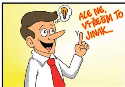
Druhý den ráno.