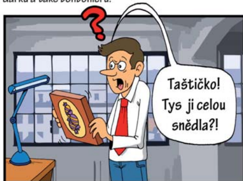
Šéf zjistil, že jsou všechny bonbóny pryč...